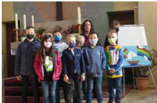
Die neuen Konfi 3 Kinder der Gruppe Hartmannshof.

Mit dem Lied: „Einfach spitze, dass du da bist“ begrüßten wir 24 neue Konfi3 Kinder aus unserer Region in der Friedenskirche in Hartmannshof.